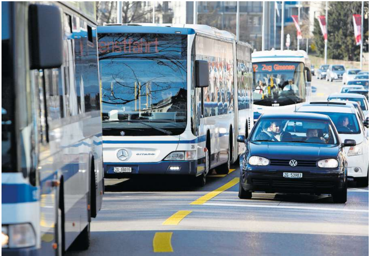
Starkes Verkehrsaufkommen in der Zuger Vorstadt.

Ein weiterer Punkt, der bei vielen auf starken Widerstand stossen dürfte, ist die Forderung, dass sämtliche Aussenparkplätze verschwinden sollen. Kissling: «Die Parkplätze machen einen grossen Teil des Verkehrs in der Stadt aus, weil die Leute nicht in den Tiefgaragen parkieren wol-