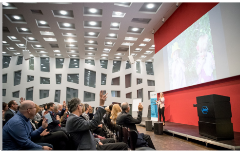
Anlass vom 15. März 2018

Alle vier Jahre stehen im Kanton Zug Gesamterneuerungswahlen an. Letztmals war dies im Oktober 2018 der Fall. Viel Spannung versprach die Wahl der kantonalen Exekutive, denn es galt, eine bisherige Regierungsrätin und zwei ebenfalls zurücktretende Regierungsräte zu ersetzen. Zehn Kandidatinnen und Kandidaten stellten sich zur Wahl in die siebenköpfige Regierung. Die Zuger Wirtschaftskammer gab keine Wahlempfehlung ab. Sie stellte jedoch auf der Website eine Wahlhilfe zur Verfügung, indem sie die Antworten der Regierungsratskandidatinnen und -kandidaten zu wichtigen Wirtschaftsfragen publizierte und über verschiedene Kanäle auf diese Möglichkeit zur Meinungsbildung aufmerksam machte.