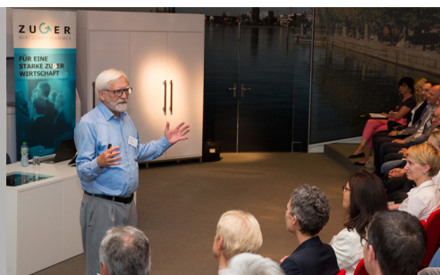
Anlass vom 11. Juni 2018

Die Zuger Wirtschaftskammer stiess ein eigenes Projekt an. Unter dem Titel «Change als Chance – Impulse für ein Umdenken in der Arbeitswelt» wurde ein Zweijahresprogramm erarbeitet. Entstanden ist eine öffentliche Veranstaltungsreihe: um zu sensibilisieren, um zu motivieren und um Handlungen auszulösen.