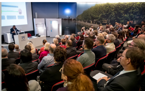
Anlass vom 22. November 2018