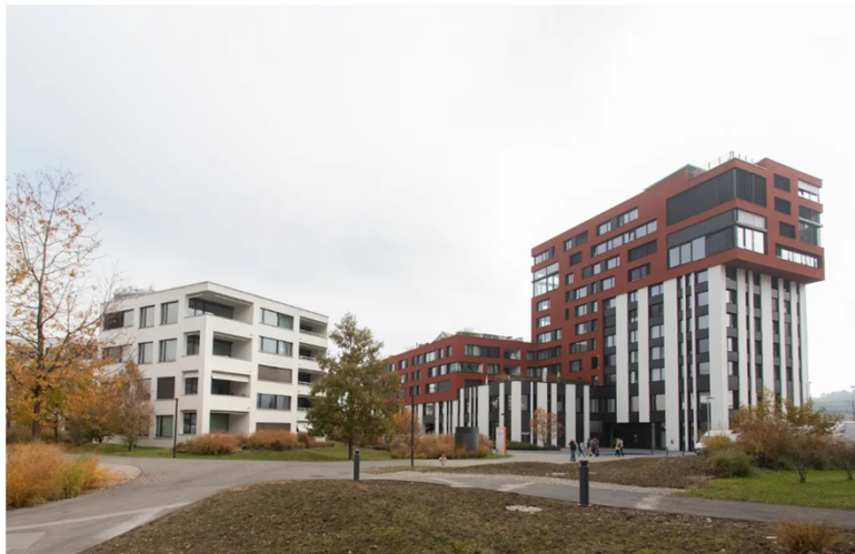
Das Suurstoffi-Areal in Rotkreuz.

(Rotkreuz, 28. Oktober