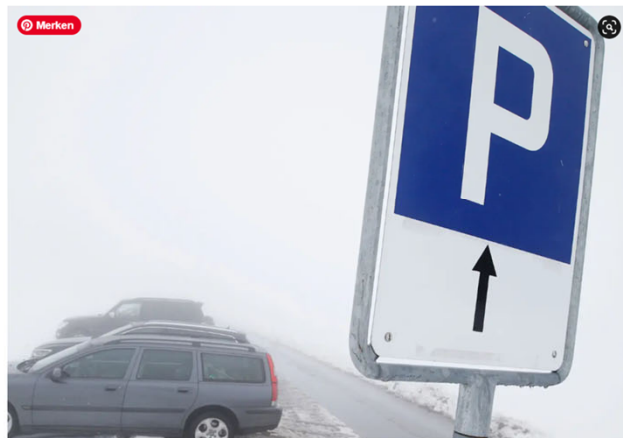
Gratisparkplätze auf dem Zugerberg kurz vor dem Vordergeissboden.

Ein Anwohner verlangt die Schliessung des Parkplatzes etwas abseits der Talstation der Bahn, der vor allem von Ausflüglern und Bikern genutzt wird. Die Zuger Verwaltungsrichter werden sich dieses Falls abermals annehmen müssen.