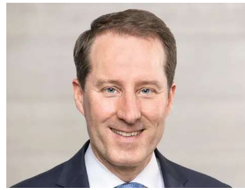
Nationalrat Thomas Aeschi.