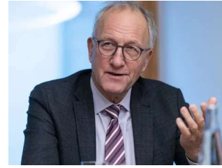
Ständerat Peter Heggin.

unser Kanton und die Zentralschweiz seit langem wieder würdig im Bundesrat vertreten.»