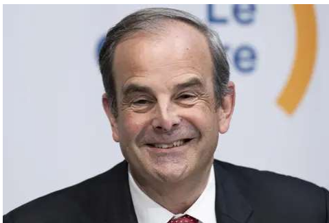
Mitte-Parteipräsident Gerhard Pfister.

«Ich wünsche Martin Pfister alles Gute in seinem Wirken zugunsten der Schweiz. Ich freue mich sehr, dass die Bundesversammlung einen dritten Zuger als Bundesrat gewählt hat