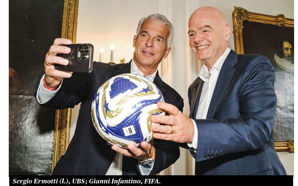
Sergio Ermotti (L.), UBS; Gianni Infantino, FIFA.

Fireside Chat mit Sergio Ermotti und Gianni Infantino