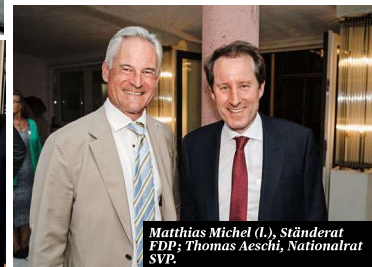
Matthias Michel (L.), Ständerat FDP; Thomas Aeschi, Nationalrat SVP.